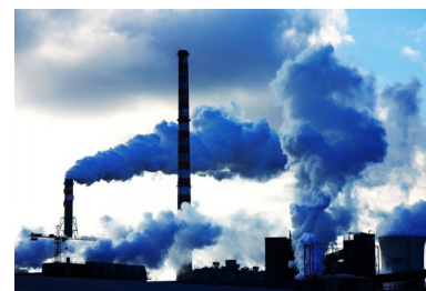
Rejet dans l'atmosphère