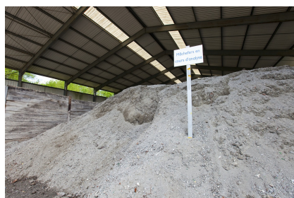
Déchets : Cendre d'un incinérateur d'ordure ménagère (mâchefer)