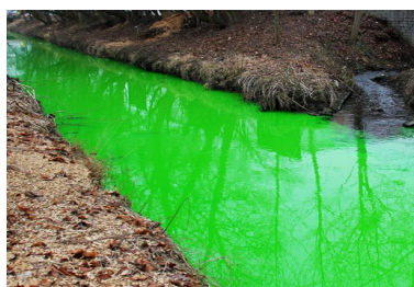
Rejet dans l'eau

Produit émis pendant une activité consommant de l'énergie comme la fumée des usines ou des voitures.