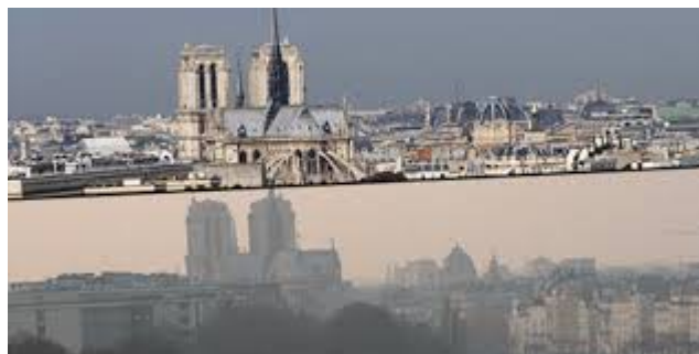
Pollution de l'air à PARIS

La pollution qui perturbe l'environnement (eau, air ...) nuit à la vie de l'Homme, des animaux, des plantes. Certaines énergies utilisées aujourd'hui ont des rejets polluants comme le gaz carbonique qui contribue à l'effet de serre.